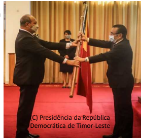
Presidente RDTL, S. E. Sr. Francisco Guterres 'Lu-Olo'

Deseju susesu tomak ba representante sira husi Timor-Leste!