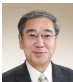
Prefeito Takashi Shirotori Sidade Ina

Delegadus hela iha neba ba preparasaun 13/07 – 20/07